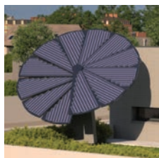
Doc. Concept YRYS by MFC

■ EDF ENR a installé dans le jardin d'YRYS une Smartflower, module photovoltaïque de production d'électricité pour autoconsommation. Ses 12 panneaux solaires s'assemblent en pétales autour d'un axe qui pivote horizontalement et verticalement. Au lever du jour, la Smartflower se déploie automatiquement et suit la trajectoire du soleil toute la journée pour se replier le soir, ajustant ainsi son angle afin d'optimiser la production d'électricité... Toujours bien orientés, naturellement ventilés et disposant d'un système de nettoyage automatique, ses 18 m 2 de panneaux PV produisent jusqu'à 40 %