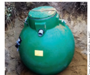
Doc. Concept YRYS by MFC

■ Enfin, YRYS est équipé d'un réservoir de 6.000 litres, installé en vide sanitaire, qui récupère les eaux pluviales. Filtrées et pompées, ces eaux sont utilisées dans les WC via un circuit dédié, ainsi que dans le jardin pour arroser notamment le mur végétal.