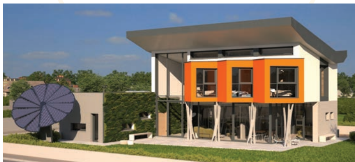
Conception architecturale Coste Architectures

à un câblage sans outils (technologie XE), le Resi9 se veut un tableau intelligent grâce à Wisser energy. Connecté à un smartphone, il permet en effet de suivre et d'analyser les consommations, notifie les dysfonctionnements et protège ainsi la maison. Enfin, le Concept YRYS by MFC